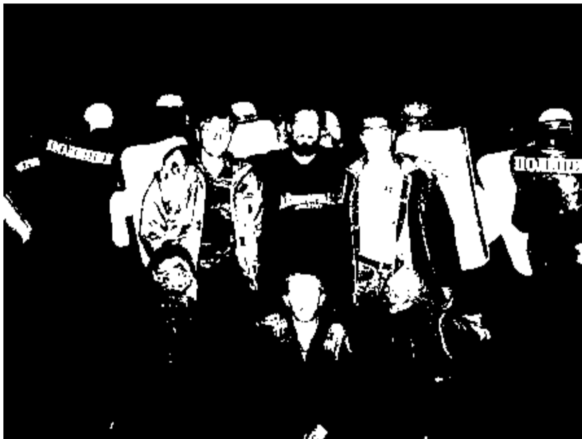
Анархисти и жители на Суходол солидарно пред полицията

Това бяха първите думи на активистите след полицейската атака на 8 юли. Младежи от София, сред които еколози, анархисти и дори националисти, забележете, се изправиха срещу държавата на една тенниска разстояние. Държавата се скри зад щитовете, палките и каските на заптиета, събрали от десетки коначи.