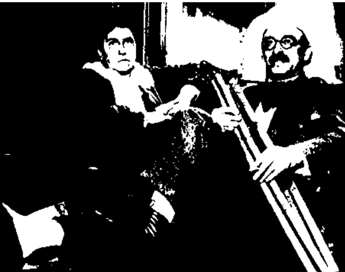
Ема Голдман и Александър Беркман

4 Джей Гулд (1836-1892) – американски финансист и борсов спекулатор. Заедно с Джеймс Фиск стои в дъното на борсовия срив през 1869, предизвикан от техните манипулации с цената на златото.