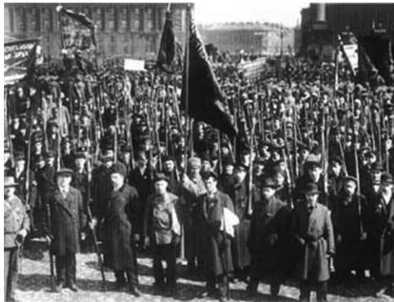
Шествие на работническите милиции в Петроград, 1917

Гледната точка на Ленин надделява и партията започва да мобилизира силите си и да се готви за евентуалната решителна битка на масите срещу временното правителство. Партията се залавя да създава партийни ядра в заводските комитети и съветите от работнически делегати, правейки всичко, което е по силите й, за да получи възможно най-много мандати и така да контролира действието на тези до момента неекспериментирани органи на самоуправление. Трябва да се отбележи, че концепцията и подходът на болшевишката партия към съветите и заводските комитети са коренно различни от тези на масите. Докато множеството работници счита съветите и заводските комитети, които самото то съставлява, за органи за своето социално и икономическо самоуправление, болшевишката партия просто гледа на тях като начин, по който е възможно да се изтръгне властта на губещата буржоазия и в последствие да използва тази власт съгласно партийната си доктрина.