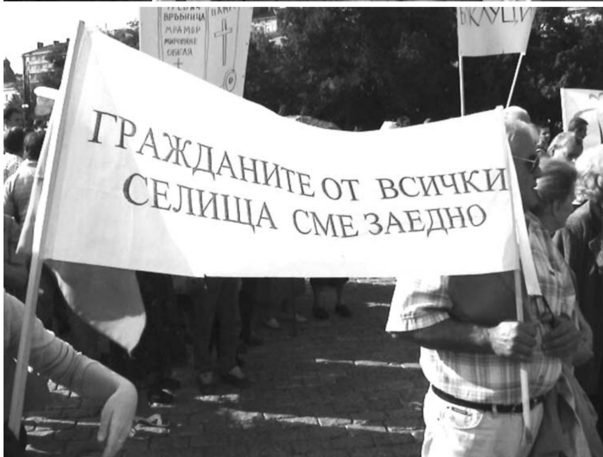
снимки от протеста на 28 септември пред „Александър Невски“

очаква да заработи машината за балиране в центъра на Требич, ще има ежедневни събирания. Хората заявяват, че все още протестират мирно, но няма да се колебаят да използват и други средства, ако продължи гаврата с тях.