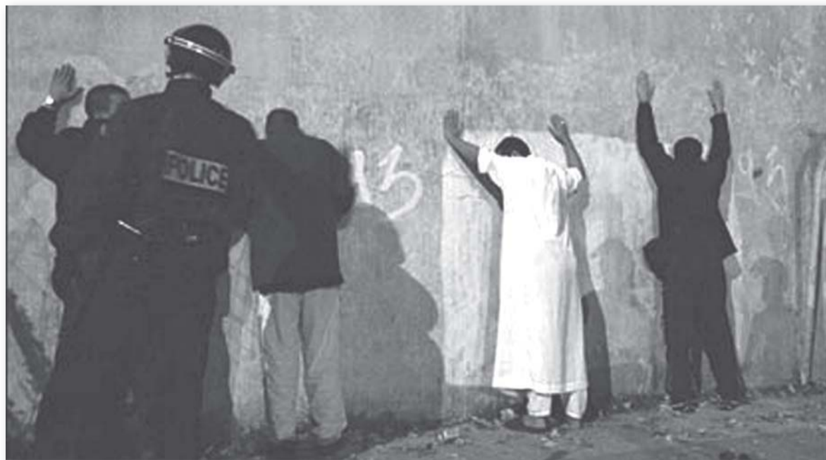
Париж: извънредни мерки или ежедневия?

то учиш и се бориш; • насилие е да бъдеш затворен в килия, липса на нормални жилища; • когато жените са докарани до положение на порно-роби-