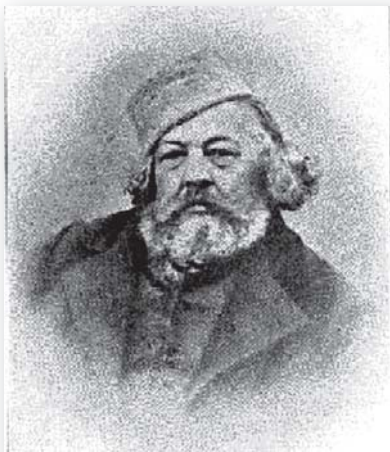
Бакунин - първоначално формиране на личността 1

Легендарният революционер със смъртни присъди от три империи и пръв теоретик на революционния анархизъм, Михаил Александрович Бакунин, е роден на 30 май 1814 година в родовото дворянско имение в с. Премухино, Тверска губерния, недалеч от Москва и е израсъл сред типична руска природа, в семейна среда, в която по думите на Белински, „всичко е дишало хармония и блаженство“. Тези биографични данни обаче изразяват само частичната истина относно факторите за първоначалното формиране на личността на Бакунин. Наред с казаното по-горе действа и един друг особено важен фактор в това отношение – нестандартната личност на баща му.