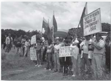
На протестите в Попинци се развяваха български знамена и хората обвиняваха държавата в антидържавна политика

Казусът с „Натура 2000“ напоследък нашумя твърде много, за да го подминем, още повече, че той е свързан пряко с две теми, които жизнено ни интересуват - екологията и ЕС. Тези дни се разбра, че хората от село Попинци, които наскоро успешно защитиха територията си от така наречените „инвеститори“ са излезли с писмо до отговорните органи за включване на района на тяхното село в тази програма. От екипа на Индимедия се свързахме с тях, за да научим подробности относно мотивите за това действие и надеждите, които те възлагат на господата с костюмчета от Запад.