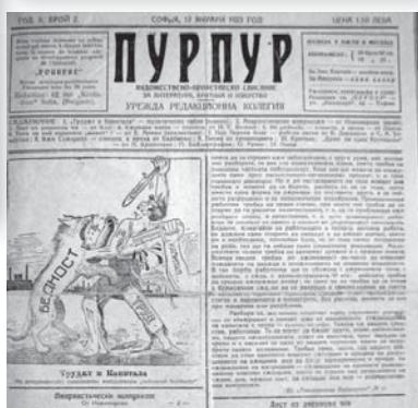
Безвластнически издания от 20-те и 30-те години на XX век