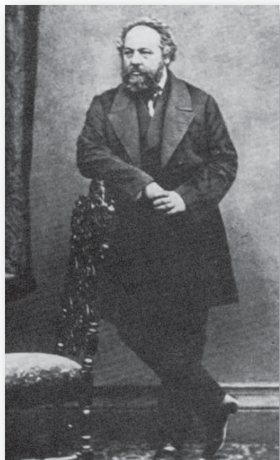
» » продължава от миналия брой

Свободата на човека се състои единствено в това, че той се подчинява на естествени закони, защото той сам ги признава за такива, а не защото са му били наложени отвън от някаква странична воля – божествена или човешка, колективна или индивидуална.