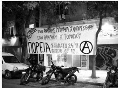
16-17 ноември: на много места в гръцки градове са опънати транспаранти за солидарност със затворените анархисти

Традиционните събития на 17 ноември завършват с яростни стълкновения между демонстранти и полиция. На ежегодните държавни манифестации, отбелязващи 34 години от бунта срещу военната хунта с окупацията на Политехническият университет и въоръженото нахлуване на армията и полицията в университета, при която загиват десетки студенти, а мнозина са изтезавани време на арестите, по традиция се отговаря с контрапротести на студенти и леви групи. Тази година са хвърляни камъни и са изрисувани стените на Върховния държавен съд, витрините на банки и магазини за луксозни стоки са счупени. Сблъсъци има и между протестиращи и цивилни ченгета, както и между протестиращи и млади членове на бившата управляваща партия ПАСОК.