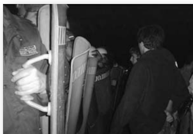
7 юли 2005: анархисти от ФАБ на блокадата пред суходолското сметище

Веднага след затварянето на депото в Суходол ек-