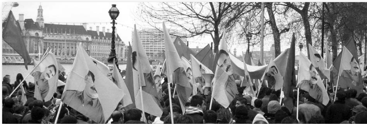
Лондон: демонстрация на симпатизанти на ПКК

Турската република в началото обявява границите си като „национален договор, включващ районите, в които живеят турското и кюрдското мнозинство“. В събралото се в Анкара първо Велико народно събрание има около 70 кюрдски народни представители, към които официално се обръщат като към „кюрдски представители“. Турският представител в Лозана Исмет паша заявява, че „кюрдите заедно с турците са основните елементи на Турската република, кюрдите на са малцинство, те са нация и анкарското правителство е колкото турско, толкова и кюрдско“. След подписването на Ло-