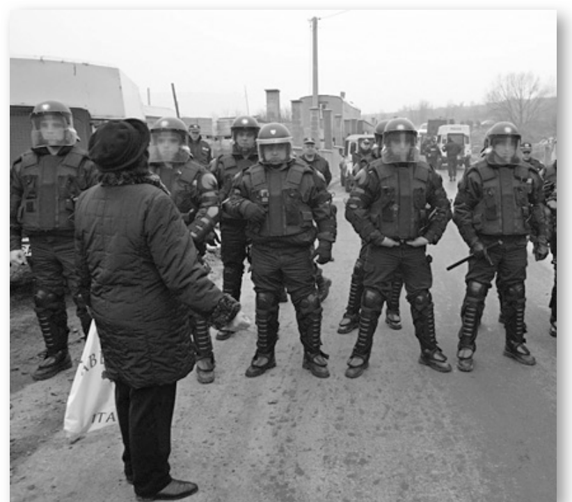
Сухогол, 2007. Не променим ли това съотношение на силите, няма да променим нищо

Изходът от безизходицата е ясен. Полицията нито иска да се реформира, нито може да се реформира, нито