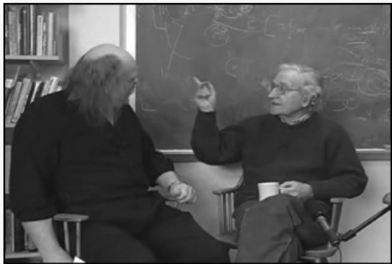
Бари Пейтман и Ноам Чомски

Разговор с Бари Пейтман в архива на Ема Голдман