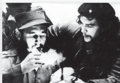
Фидел Кастро и Ернесто Че Гевара

След лятната ваканция през 1967 г., когато отново се бяха заредили дни, изпълнени с труд и учение и обратно , ако употребим любимите тодорживковски обрати на словото, световните телеграфни агенции разпространиха на 9 октомври новината за за гибелта на аржентинския герилеро и член на кабинета на Фидел Кастро – Ернесто Гевара.