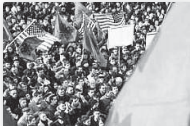
НЕЗАВИСИМОСТ? На косовските митинги американските знамена често са колкото тези на „народа на орела“

Китай е типичен пример за страна, за която независимостта на Косово е ге-