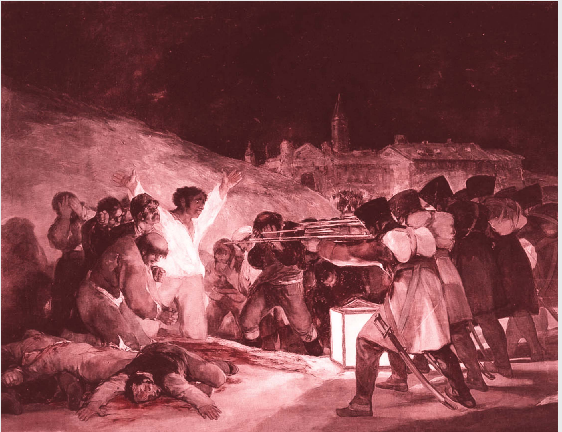
Франсиско Гоя • „3 май 1808: Разстрел в Монтана дел Принсипе Пио“ (1814)