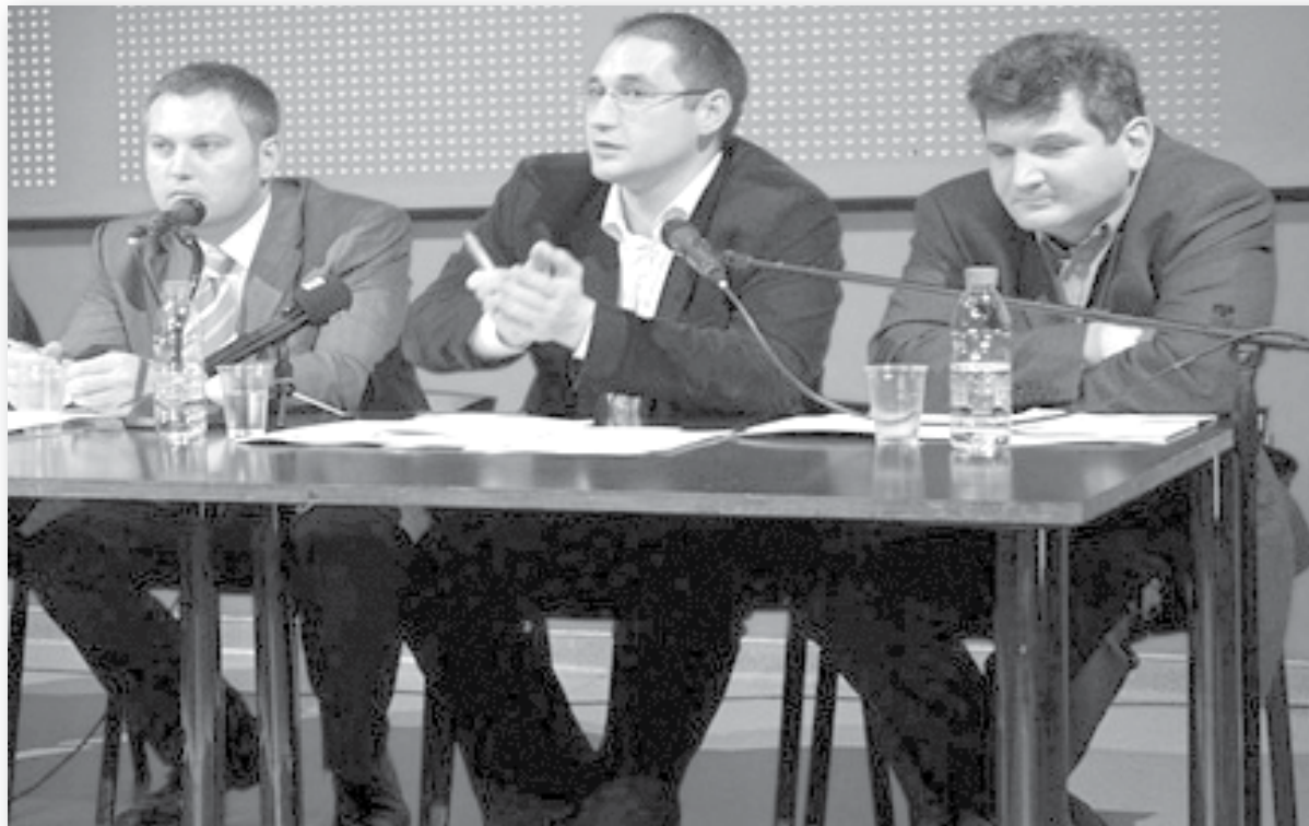
Жреците на пазарната стъкмистика: те винаги познават какво е било времето вчера.

Ако искаш да прочетеш някое различно мнение по въпросите на политикономията, ще трябва да при-