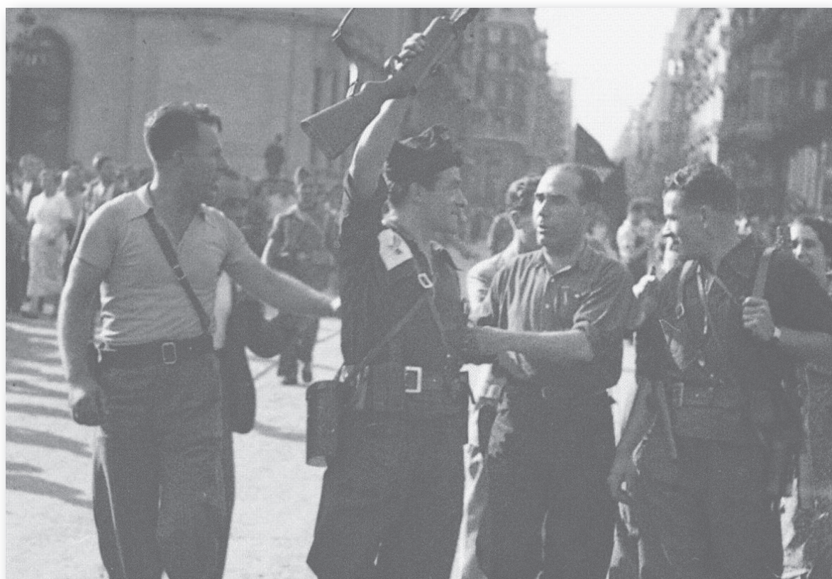
Хуан Гарсия Оливер с другари анархисти след победата над военния пуч на 19 юли 1936 г.