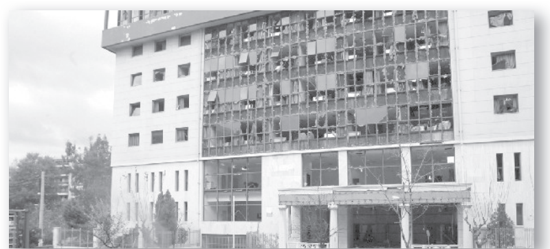
Сградата на атинския съд след взрива на 30 декември 2010 г.