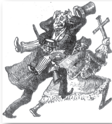
... и „Ейос“ („Те“)

На CNT се падаше да демонстрира, че е възможно да извърши революцията, без да налага своята диктатура. Нейната сила почиваше върху колективния ѝ капацитет. Защо трябва да предричаме неуспеха на своята революция? Да се мисли така, означава, че нямаме доверие в собствените си идеи. Анархистите вярват в човека. Това е съществена разлика с марксистите. В Испания синдикализмът прокламира анархистическата идея от самото начало. Беше дошъл часът