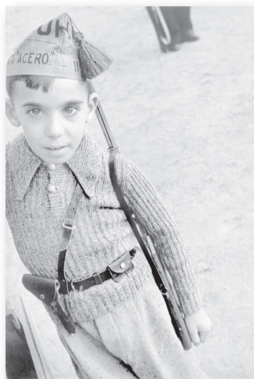
Знаменитата снимка на Робърт Капа „Момче с шапката на анархистката милиция „Пролетарските братя“ (Барселона, 1936)

Но какво беше мнението на Организацията, на хората, които проливаха кръвта си в една неравна и въпреки това