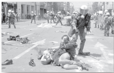
Типична картина от южнокорейските стачки

Съвременните работници от Източна Европа практически не познават явлението „бойни профсъюзи“, способни да стачкуват много седмици, да оказват физическа съпротива на полицията и на работодателите, да окупират предприятия. Реално погледнато, такива профсъюзи вече няма почти никъде в света. Изключение е страната, в която такива синдикати наистина представляват мощна обществена сила и могат да бъдат наречени „бойни“ – Южна Корея. От двете най-мощни организации, Корейската конфедерация на професионалните съюзи (ККПС) се счита за по-„бойна“ – доскоро емблематична с червените ленти на главата и водопроводните тръби в ръката, докато Федерацията на корейските професионални съюзи (ФКПС) е по-„бюрократична“. Миналата година три големи синдиката се отцепиха и създадо-