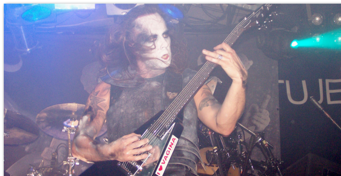
2 години затвор очаква Адам „Нергал“ Дарски от полската метал група Бехемот за късането на библия на сцената

Държавата обаче е по-благосклонна към православните оскърбени, защото Православната църква от създаването си винаги е верен страж и крепител на властниците, дори когато те не са покръстени