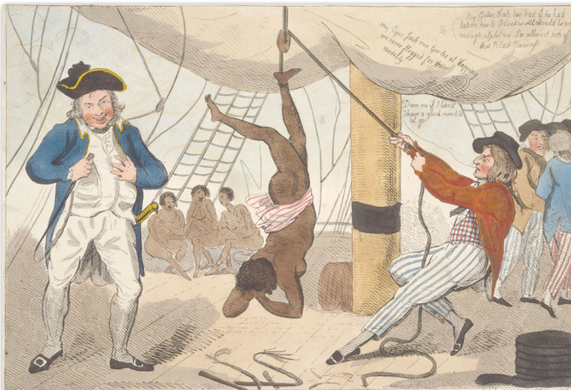
...и порядъчните търговци (оригинална рисунка, 10 април 1792)

„Морските разбойници“ били дотолкова неморални за времето си, че без никакви