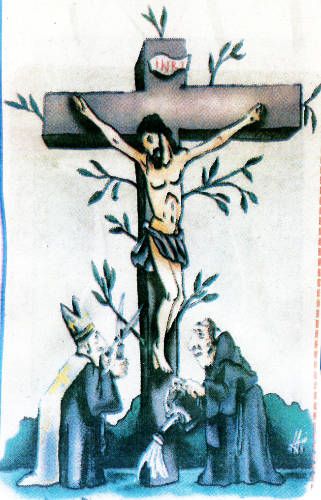
Карикатура Никола Оташ Препечатано от вестник Стършел