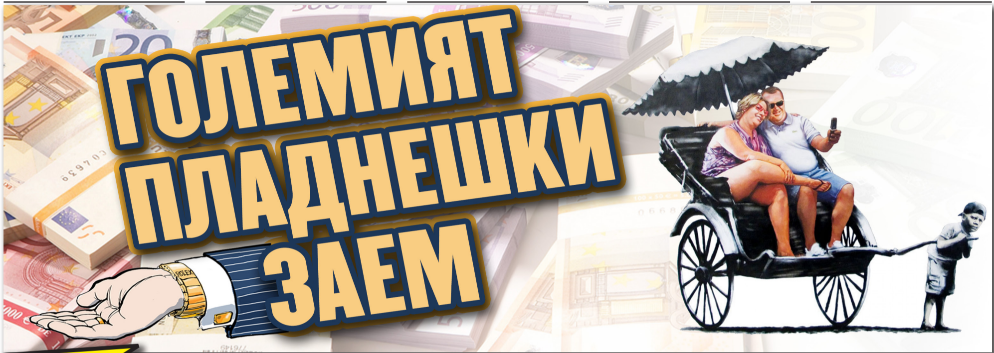
ГОЛЕМИЯТ ПЛАДНЕШКИ ЗАЕМ