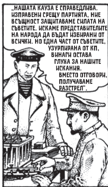
БУНТОВНИЦИТЕ ИЗПРАТИЛИ ОБРЪЩЕНИЕ ДО ЦЯЛАТА СТРАНА.