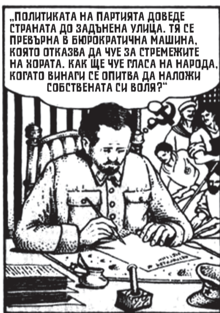
ЗАВАЛЕЛИ ОСТАВКИ НА ПАРТИЙНИ ЧЛЕНОВЕ.